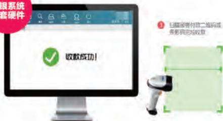
收银系统 配套硬件

收银系统配套设备 (收银电脑、小票打印机、高清摄像头、扫描枪、钱箱、) 用户可自备